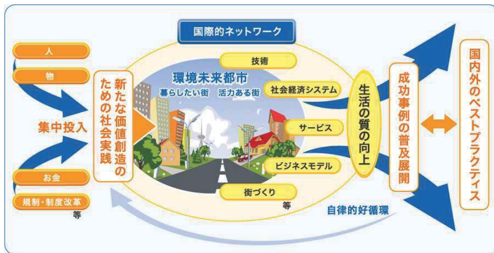
(자료: 환경도시미래 구상, http://futurecity.rro.go.jp )

추진하는 프로젝트에서 엄선하고 보조금, 세제, 규제완화 등을 통해 이를 집중적으로 지원하고 있다. 또한 이렇게 개발된 환경미래도시 모델을 패키지로 해외에 수출하고 아시아 국가들과는 정부간 협력을 추진하고자 한다. 일본은 이상과 같은 목적을 달성하기 위해 ‘환경미래도시정비촉진법’을 제정하였다.