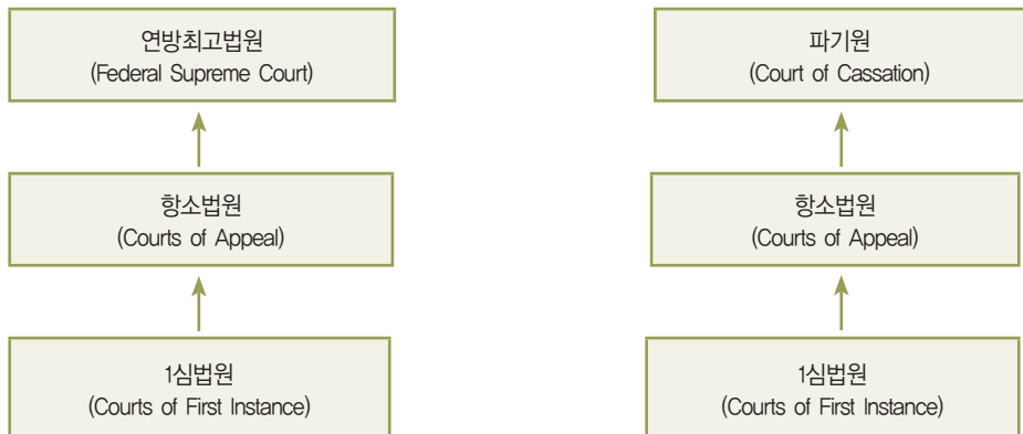
【표1】UAE 법원 구조

UAE 법원은 소송당사자가 법률 규정에 따라 변호사를 임명할 수 있다. 변호사는 국가 공증인, UAE 대사관(또는 영사관)에 의해 정식 서명날인이 된 위임장을 가지고 스스로 소송대리인으로 임명된 것을 증명해야만 변호인으로서의 자격을 가진다.