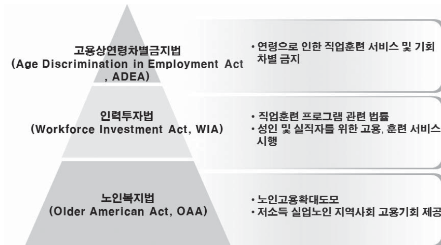
〈그림 1〉 미국의 고령자 복지 법제

이러한 상황에서 미국의 고령자 복지 법제와 이를 토대한 프로그램을 고찰하는 것은 우리나라 고령자 취업 준비와 이들의 고용 질 향상을 위한 국가 정책을 모색하는데 시사점을 제공한다.