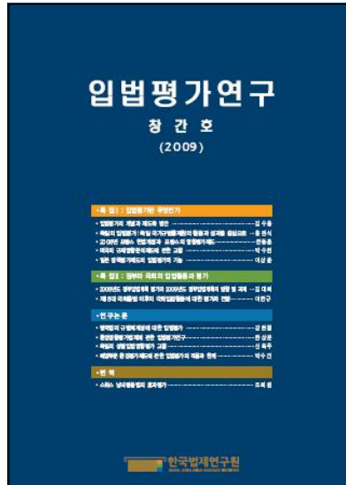
▶ 입법평가연구 (창간호)