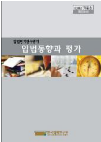
▶ 입법동향과 평가 (겨울호)