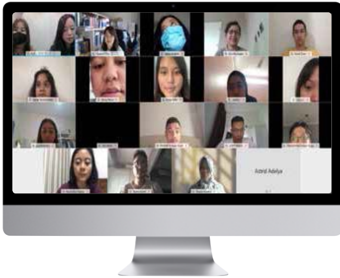
인도네시아 특강 참석자 사진